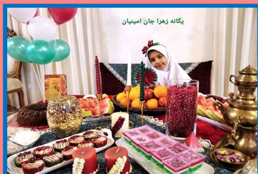
Yalda/Chella Celebration in an Iranian Children School, City of Sarakhs, Iran