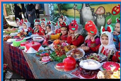
Yalda/Chella Celebration in an Iranian Children School, Gilan Province, Iran