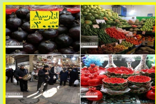
Yalda/Chella Bazaar (Market), Tehran Province, Iran