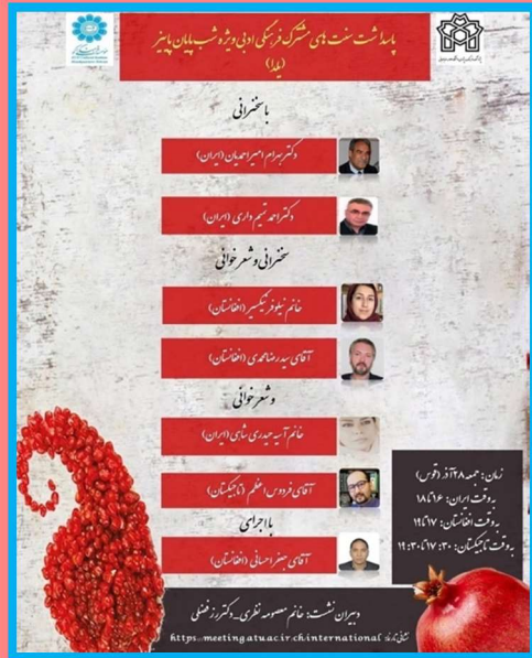
Webinar Organised by ECO Cultural Institute; Afghan, Iranian, & Tajik Lecturers & Poets

۲. اقدامات مشترک مردم ایرانیان و افغانستان برای جشن یلدا/چله