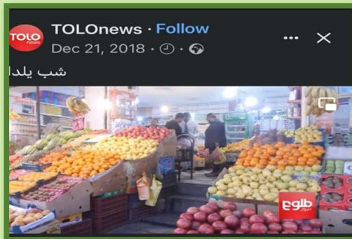
Yalda/Chella Bazaar (Market), Herat, Afghanistan