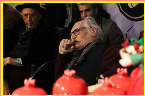
Yalda/Chella Celebration Organised by Carbon Book Cafe, Tehran, Iran