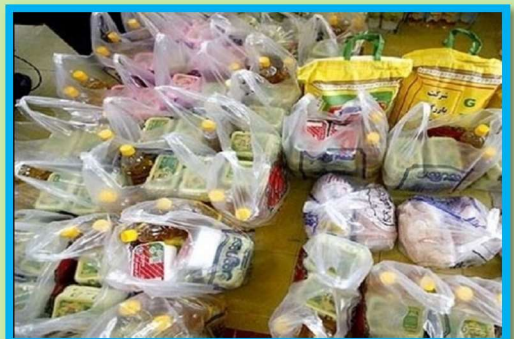
Yalda/Chella Relief Packages Organised by Semnan Province, Iran