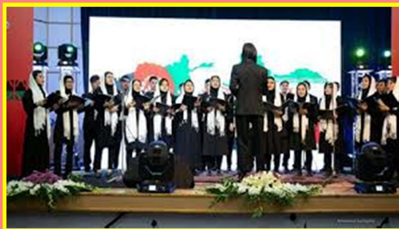
Yalda/Chella Celebration by Iranian & Afghan Choirs