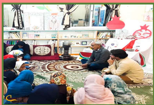
Yalda/Chella Celebration in an Iranian Home, Hormozgan Province, Iran