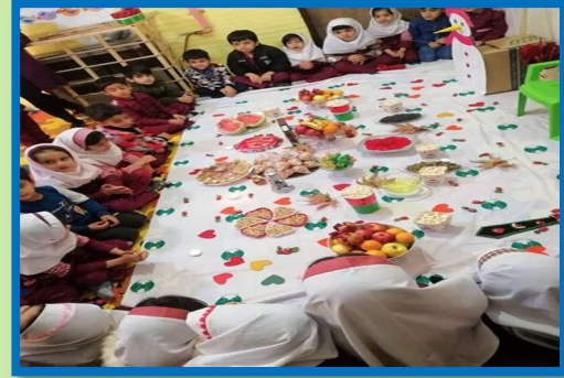
Yalda/Chella Celebration in an Iranian Kindergarten, City of Yasouj, Iran