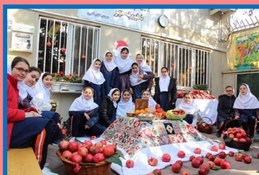
Yalda/Chella Celebration in an Iranian Children School, City of Tehran, Iran