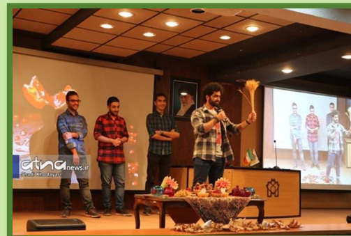
Yalda/Chella Celebration in Allameh Tabatabaie University City of Tehran, Iran