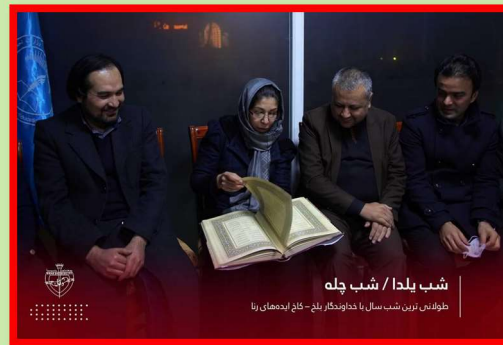
Yalda/Chella Celebration in Rana University City of Kabul, Afghanistan