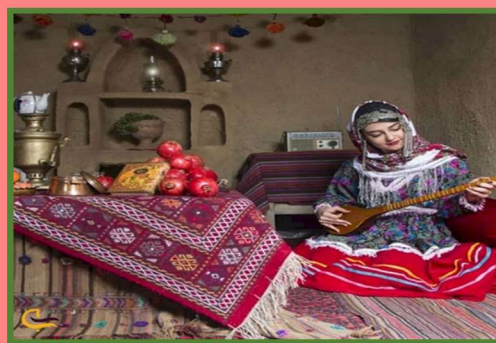
Yalda/Chella Celebration in an Iranian Home, South Khorasan Province, Iran