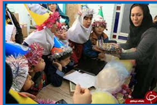
Yalda/Chella Celebration in an Afghan Children School