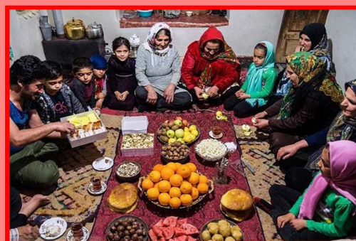
Yalda/Chella Celebration in an Afghan Home, Balkh, Afghanistan