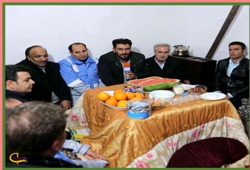
Yalda/Chella Celebration in an Iranian Home, Semnan Province, Iran