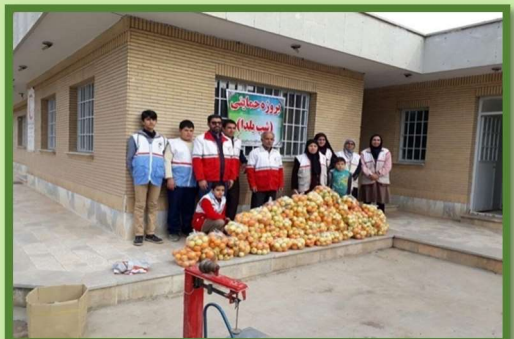
Yalda/Chella Relief Packages Organised by Razavi Khorasan Province, Iran