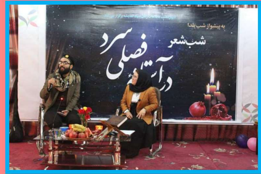
Yalda/Chella Celebration Organised by Andisheh Foundation, Kabul, Afghanistan