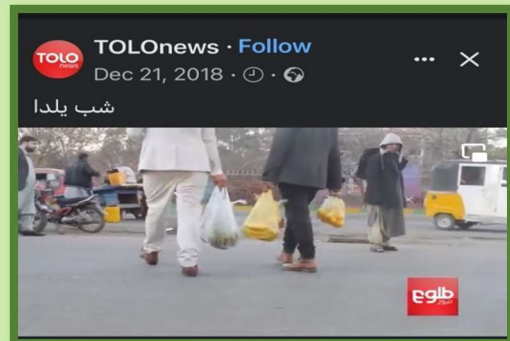
Yalda/Chella Bazaar (Market), Herat, Afghanistan