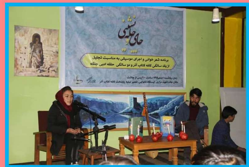
Yalda/Chella Celebration Organised by Azar Kafeh Ketab Club, Kabul, Afghanistan