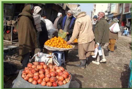
Yalda/Chella Bazaar (Market), Balkh, Afghanistan