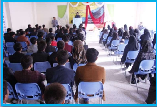
Yalda/Chella Celebration Organised by Cheshem Literary Club, Kabul, Afghanistan