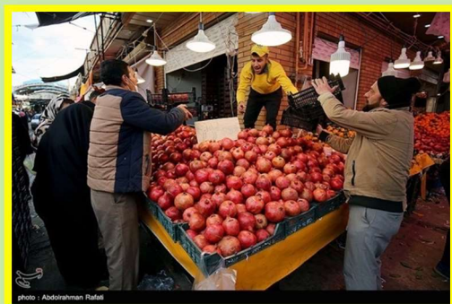
Yalda/Chella Bazaar (Market), Hamedan Province, Iran