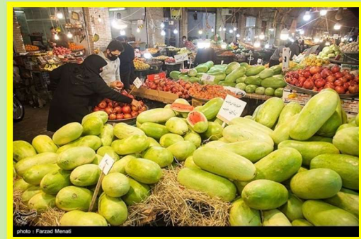
Yalda/Chella Bazaar (Market), Kermanshah Province, Iran