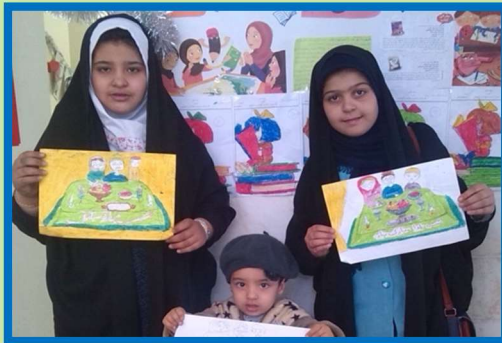
Painting of Yalda/Chella Celebration by Children, Iran