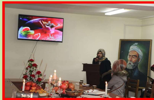
Yalda/Chella Celebration in Shahid Rajaie University City of Kabul, Afghanistan