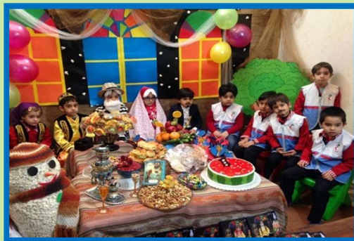
Yalda/Chella Celebration in an Iranian Kindergarten, City of Qom, Iran