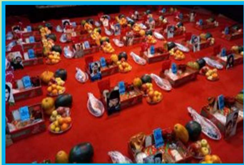
Yalda/Chella Relief Packages Organised by Mazandaran Province, Iran