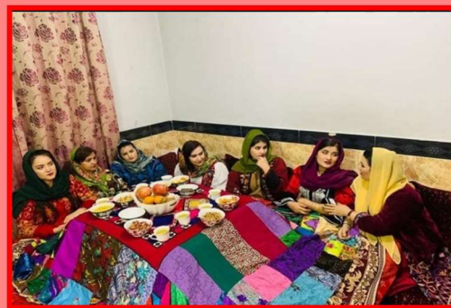
Yalda/Chella Celebration in an Afghan Home, Herat, Afghanistan