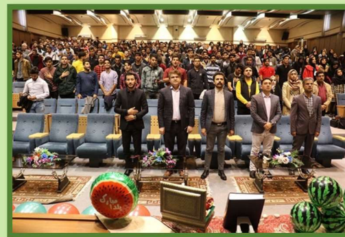
Yalda/Chella Celebration in Ilam University City of Ilam, Iran