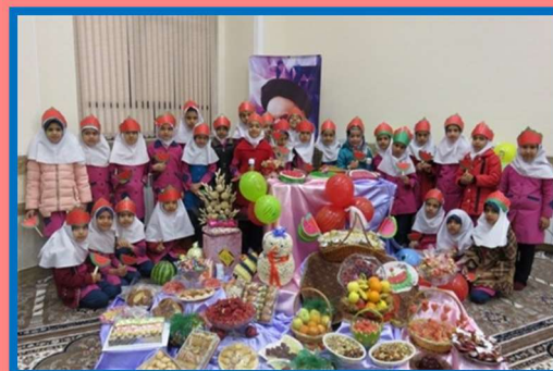
Yalda/Chella Celebration in an Iranian Children School, Robat Karim, Iran