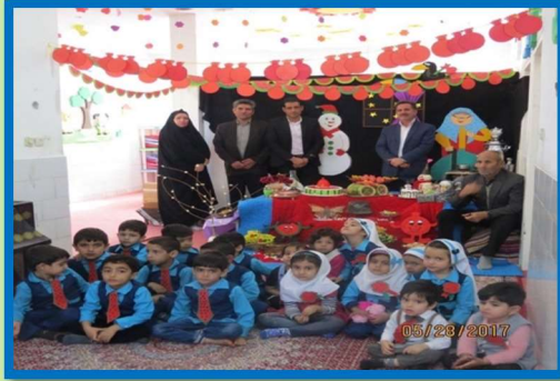
Yalda/Chella Celebration in an Iranian Kindergarten, City of Yazd, Iran