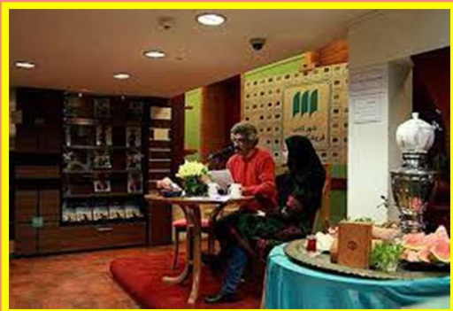
Yalda/Chella Celebration Organised by Central Book City, Tehran, Iran