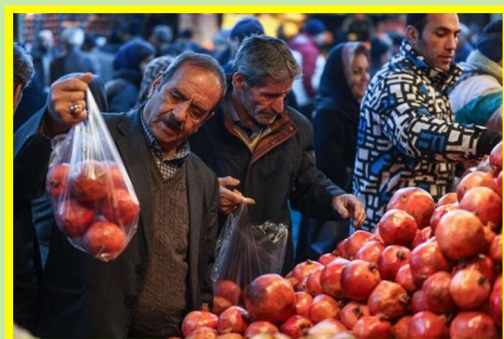
Yalda/Chella Bazaar (Market), Zanjan Province, Iran