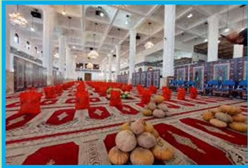
Yalda/Chella Relief Packages Organised by Gilan Province, Iran

مردم برای فقرا در حین جشن یلدا خیرات می کنند