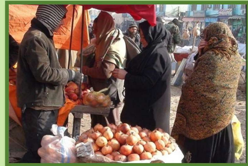
Yalda/Chella Bazaar (Market), Balkh, Afghanistan