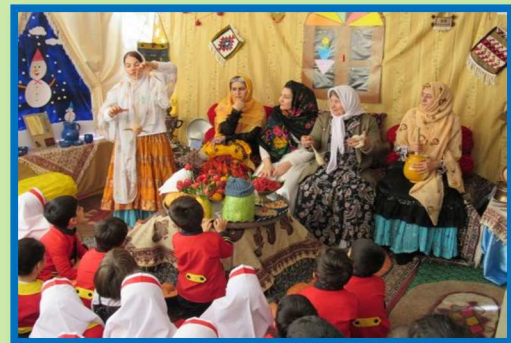
Yalda/Chella Celebration in an Iranian Kindergarten, City of Fereydoun-Shahr, Iran