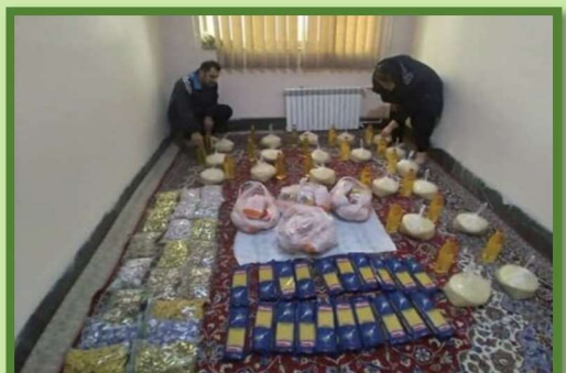
Yalda/Chella Relief Packages Organised by Alborz Province, Iran