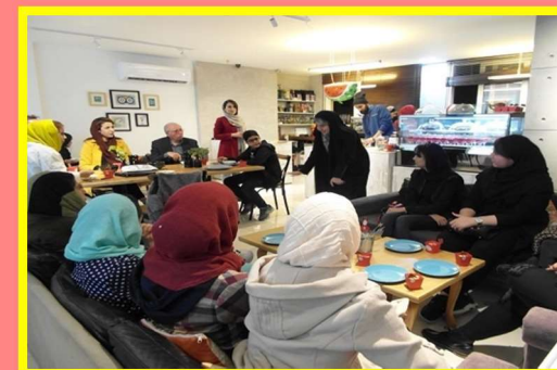
Yalda/Chella Celebration Organised by Koodak Foundation, Tehran, Iran