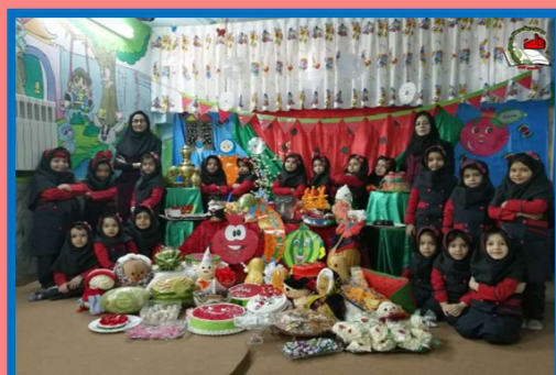
10 Yalda/Chella Celebration in an Iranian Children School, City of Kashan, Iran