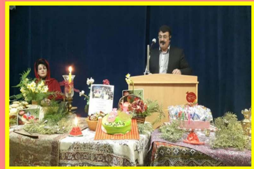
Yalda/Chella Celebration Organised by Eshragh Cultural Centre, Tehran, Iran