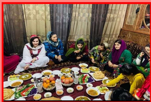
Yalda/Chella Celebration in an Afghan Home, Kubul, Afghanistan