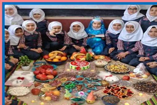
Yalda/Chella Celebration in an Iranian Children School, Hamedan Province, Iran