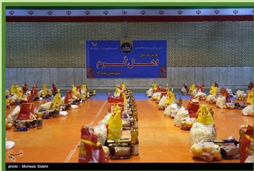
Yalda/Chella Relief Packages Organised by Isfahan Province, Iran