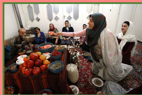
Yalda/Chella Celebration in an Iranian Home, Tehran Province, Iran