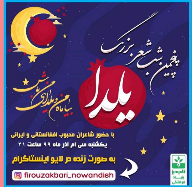
Poetry Night for the Occasion of Yalda/Chella; Instagram Live Programme organized by Qalam-e Sabz Cultural Foundation