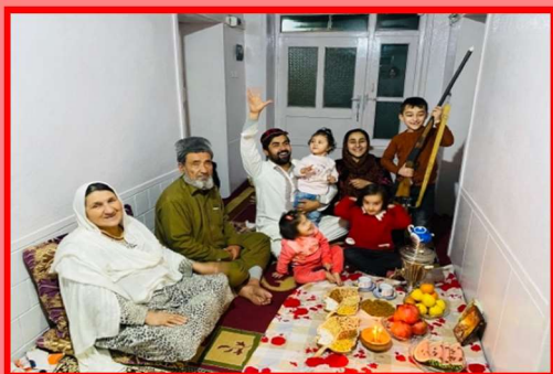
Yalda/Chella Celebration in an Afghan Home, Talghan Tokhar, Afghanistan