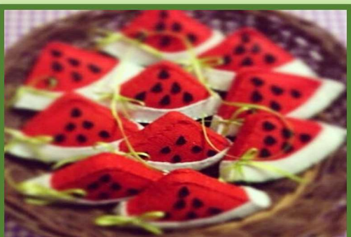
9 Yalda/Chella Relief Packages Organised by West Azarbaijan Province, Iran