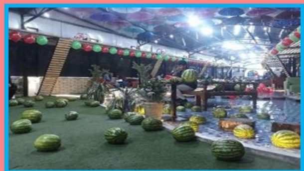
Yalda/Chella Celebration by Iranians & Afghans in the City of Herat, Afghanistan