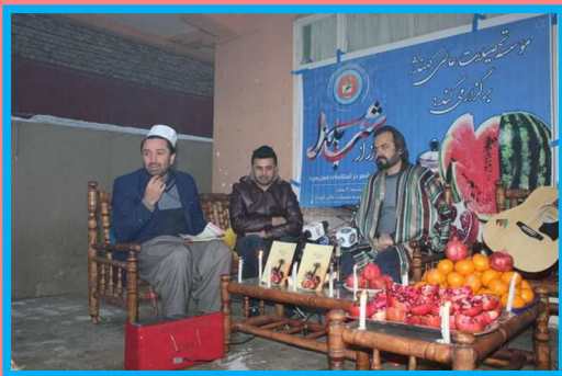
Yalda/Chella Celebration Organised by Kohandezh Institute, Konduz, Afghanistan